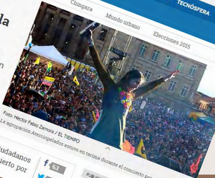
La agrupación Atercopelados estuvo en tarima durante el concierto por el medioambiente.

Por BOGOTÁ | © 10:24 p.m. | 22 de septiembre de 2015